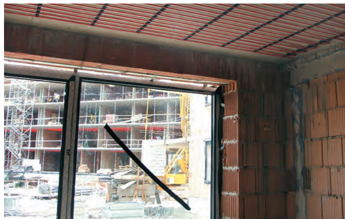
1. ábra. Vakolatos rendszer – (Apartmantelep, Balatonlelle)